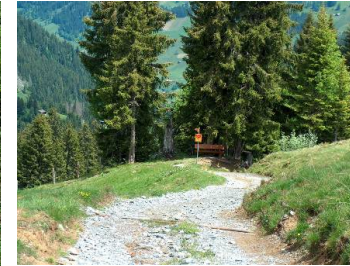
Einstieg ins Wandergebiet 100 Meter vom Chalet